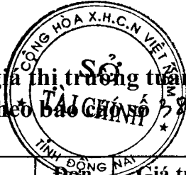
Bảng giá thị trường tuần 03 tháng 01/2017 (Ban hành kèm theo Báo cáo số 289/BC-STC ngày 21/01/2016)